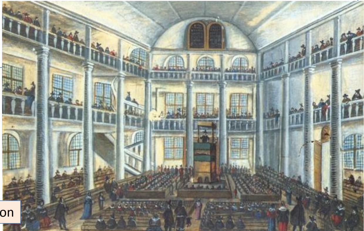
Temple calviniste de Charenton